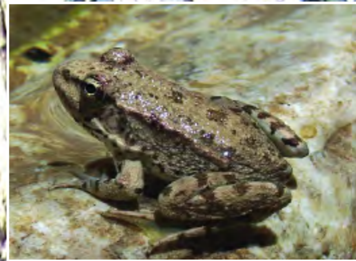
Βαλτόβιος βάτραχος - Marsh Frog - Rana ridibunda