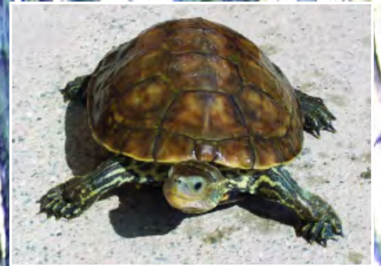
Χελώνα του γλυκού νερού - European pond-turtle - Mauremys caspica rivulata