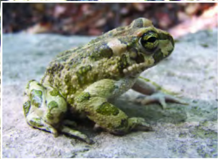
Ιριόξαν βάτραχος - Green Toad - Bufo viridis