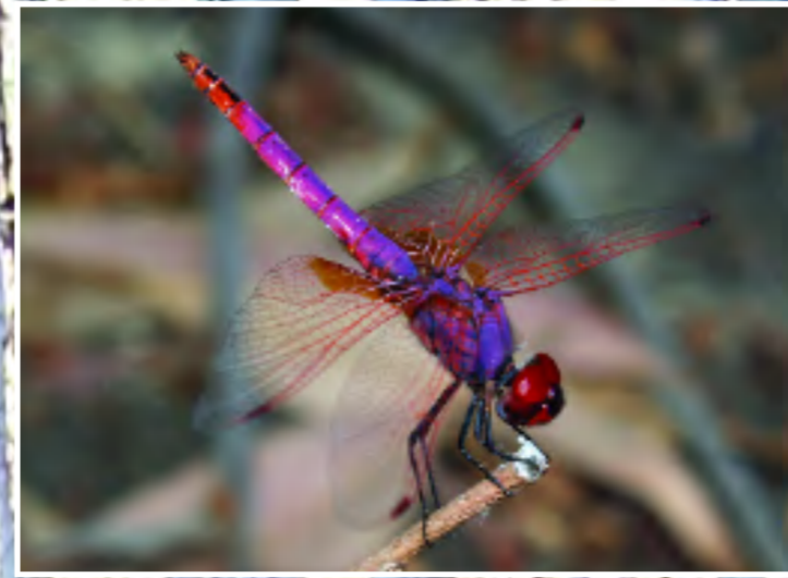
Εθικοντερόκι (Αιβαληρούνη) - Purple-blushed damselfly - Trithemis annulata